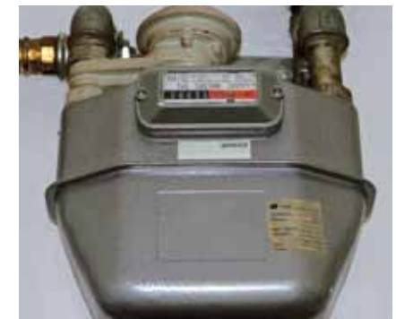
Erdgas: mindestens 2 x pro Jahr kontrollieren.