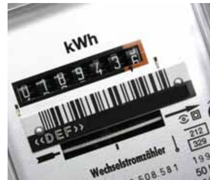
Strom: mindestens 2 x pro Jahr kontrollieren, ggf. Unterzähler einbauen.

Auf den folgenden Seiten erfahren Sie alles Wissenswerte über richtiges Heizen und Lüften sowie praktische Beispiele, was Sie zu Hause tun können. Dazu gehört auch, wie Sie Schimmel in den eigenen vier Wänden vermeiden können.